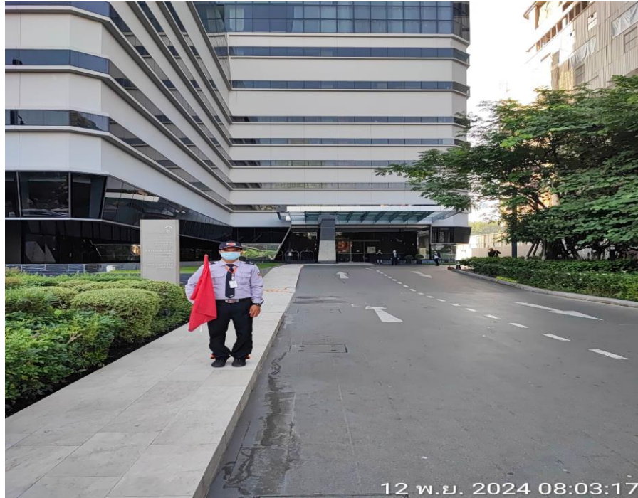
รูปที่ 3 แสดงเจ้าหน้าที่อำนวยความสะดวก ประจำพื้นที่บริเวณที่จอดรถ

โครงการ แอสคอต เอ็มบาสซี สาทร ระยะดำเนินการ ช่วงเดือนกรกฎาคม 2567 ถึง เดือนธันวาคม 2567