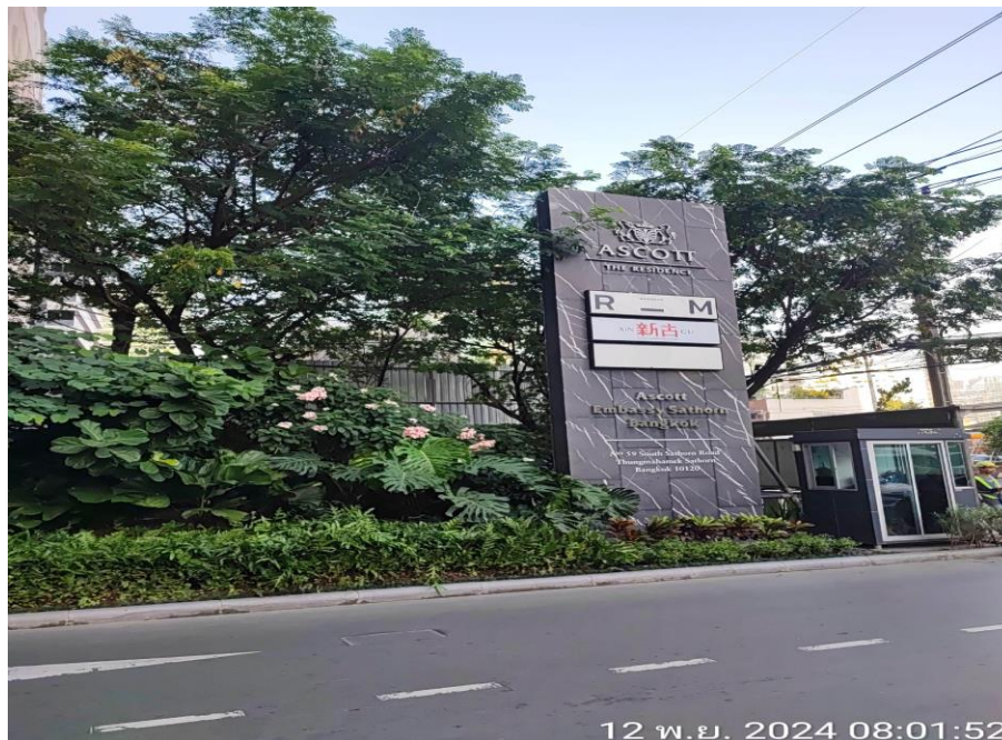
รูปที่ 4 แสดงป้ายชื่อโครงการชัดเจน