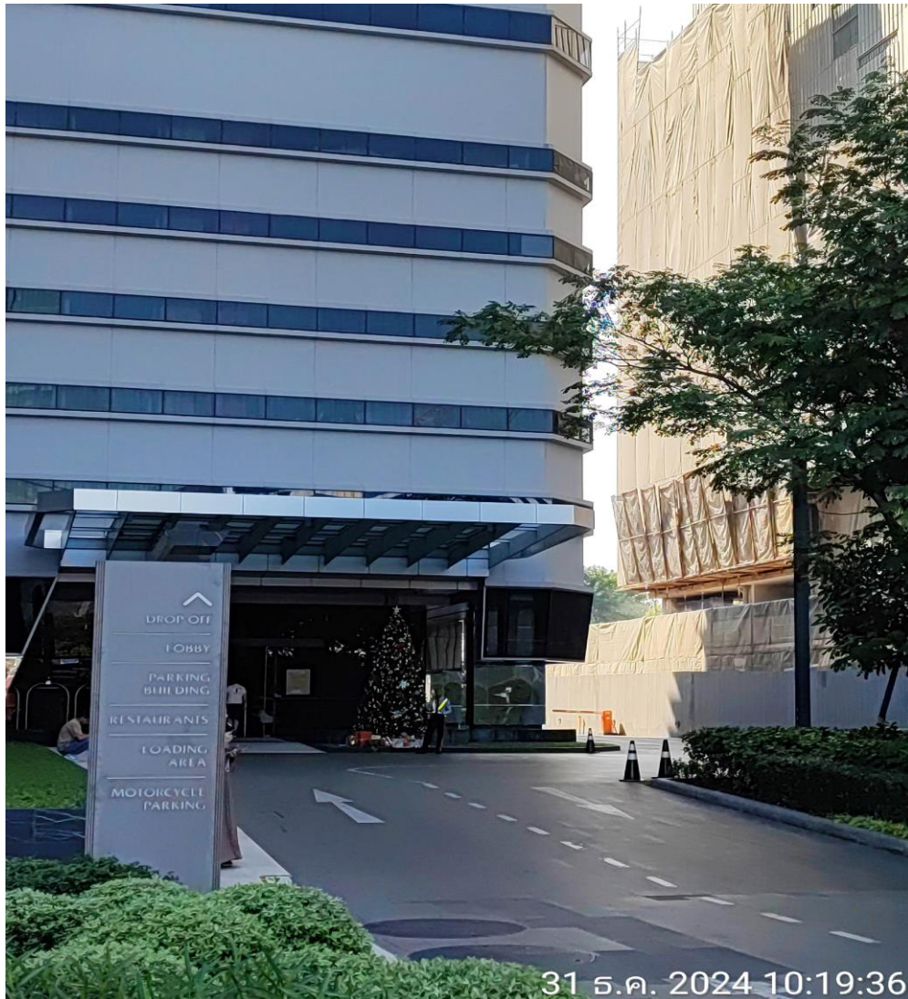
รูปที่ 2 แสดงทางเข้า-ออกโครงการ