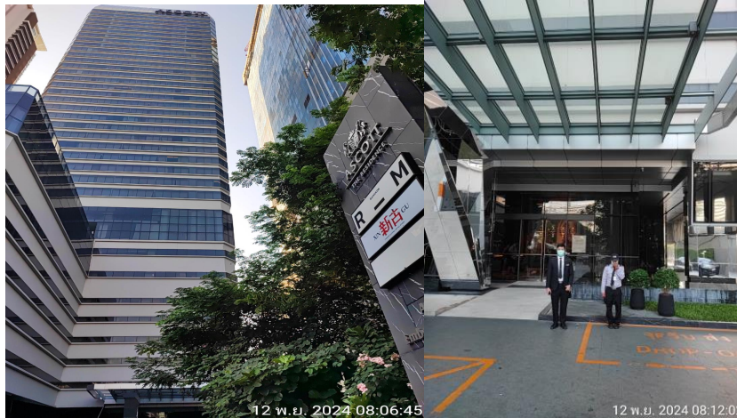
รูปที่ 10 แสดงด้านหน้าของโครงการ

โครงการ แอสคอตท์ เอ็มบาสซี สาทร์ ระยะดำเนินการ ช่วงเดือนกรกฎาคม 2567 ถึง เดือนธันวาคม 2567