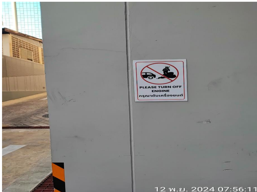
รูปที่ 6 ป้ายห้ามติดเครื่องยนต์ทิ้งไว้ภายในบริเวณพื้นที่จอดรถโครงการ