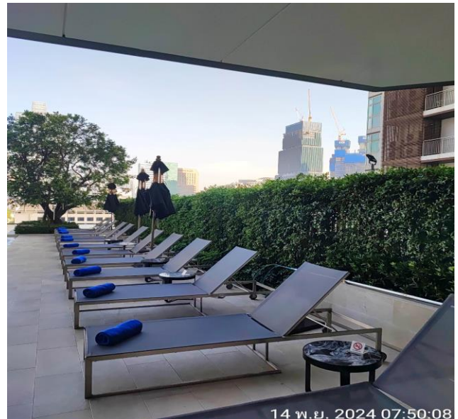
รูปที่ 10 แสดงต้นไม้ชั้นสระว่ายน้ำของโครงการ