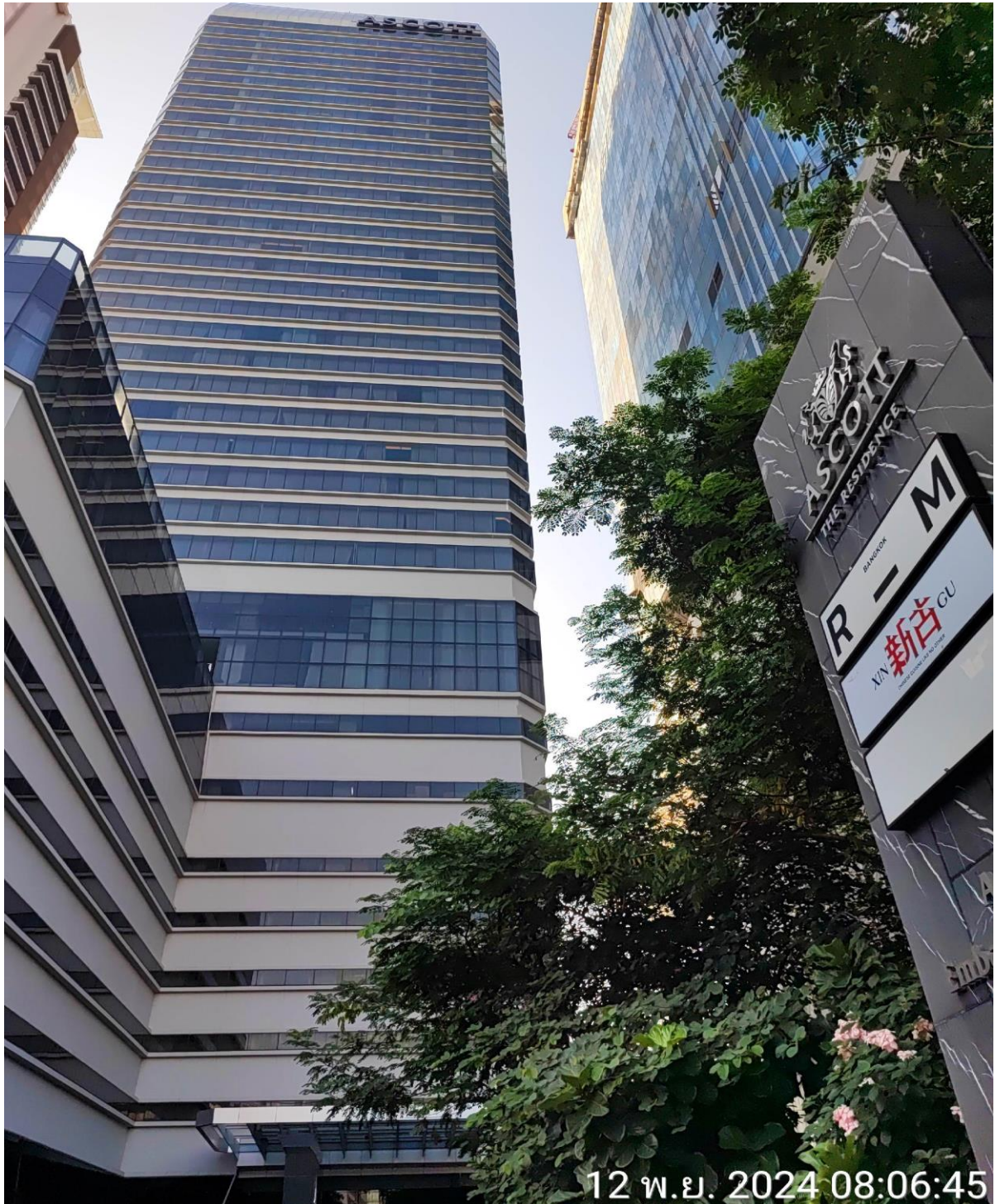
รูปที่ 1 แสดงอาคาร ณ ปัจจุบัน